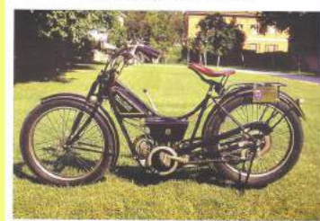
Mignon 123cc per stagione ed ecclesiastico (1924)