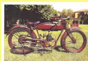
Mignon 123cc (1924)