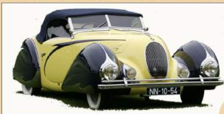
Talbot Darracq T150 del 1938

La sfortunata avventura italiana coincise con l'inizio del declino per la Darracq: il 1909 fu un anno difficile per via di una crisi economica generale in tutta Europa. Inoltre, all'inizio degli anni dieci, i modelli prodotti riscossero poco successo commerciale, anche a causa della meccanica inaffidabile. Nel 1912 Alexandre Darracq si ritirò e lasciò la Casa nelle mani di Owen Clegg, un inglese già esperto nel settore automobilistico, il quale riuscì a risollevarne per un po' le sorti dell'azienda. La prima guerra mondiale creò però enormi difficoltà per la Casa francese, la quale dovette acquisire la Talbot e la Sunbeam, due Case automobilistiche inglesi. Inizialmente, il marchio sopravvisse nei modelli prodotti in Francia e in Gran Bretagna, ma poco tempo dopo dovette fondersi in un unico gruppo denominato S.T.D. (Sunbeam-Talbot-Darracq) che nel 1920 fu assorbito dall'inglese Rootes, facendo sparire definitivamente il marchio Darracq.