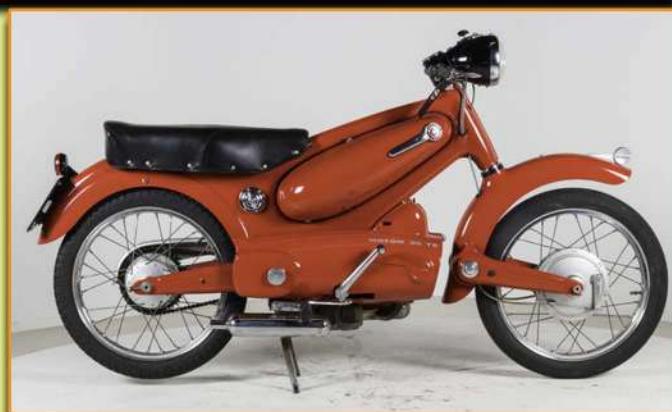
Motom 98T - 1955