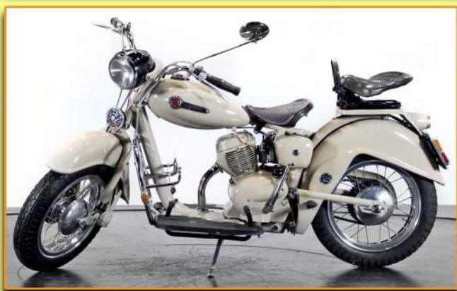
Motom Delfino 160cc - 1952