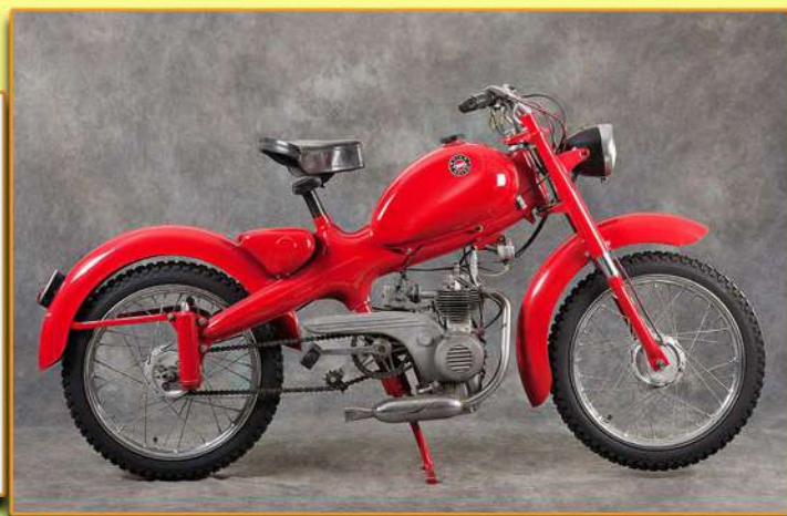
Motom 48D - 48cc - 1961