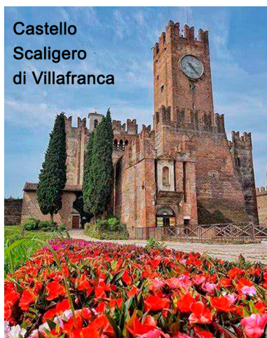
Castello Scaligero di Villafranca