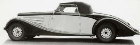
Una cabriolet Eclipse di Pourtout

La Lancia Belna in foto è stata prodotta nel 1934 dalla Carrozzeria Paul Nee di Parigi, nota soprattutto per le realizzazioni su telai Bugatti attiva dal 1921 fino agli anni 50. Si stima siano stati realizzati una trentina di esemplari personalizzati a seconda delle esigenze dei clienti. La vettura in oggetto riprende gli stilemi di quegli anni con la capote aerodinamica e la parte posteriore molto allungata. I pannelli metallici sono accoppiati con minuscoli chiodini all'intelaiatura in legno, i parafanghi, la capote e le portiere, sono imbullonate su montanti in legno. La vettura recentemente, è stata oggetto di un restauro lungo e laborioso che ha interessato tutte le sue parti, coinvolgendo molti artigiani specializzati. Il motore originale è stato totalmente revisionato con componenti nuove, il montaggio, gli impianti, e la parte elettrica sono stati curati da uno specialista a BRA (CN), gli interni e la capote sono state realizzate da Maieli (MN) gran parte della carrozzeria e la verniciatura sono state curate della Nuova Carrozzeria Maranese, i filetti verniciati a mano libera, sono di un professionista veneto. Tutta la rifinitura e il collaudo su strada sono stati portati a termine da Francesco Bruno. La vettura verrà esposta nel nostro stand alla Mostra di Auto e Moto d'Epoca che si terrà a Bologna dal 26 al 29 Ottobre 2023. Invitiamo tutti soci ed amici a partecipare alla manifestazione che sarà in una nuova location, più comoda ed estesa.